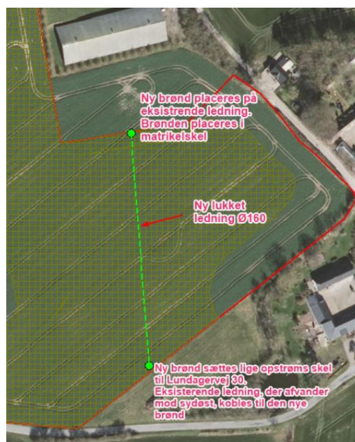
Kort 1. Lundager Skov m. de 4 delprojekter (rød cirkel). Kort 2. Placering af ny lukket ledning mell. nr. 28 og 30.