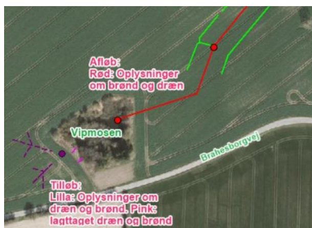
Kort 3 Oplysninger om dræn til og fra vandhullet Vipmosen

Drænsystemet omkring vandhullet Vipmosen der ligger ca. 300 m vest for Lundagervej 30 ønskes også nedlagt, for at sikre en mere naturlig hydrologi i skoven. Der er ingen oplysninger om, at naboer afvander til disse dræn. Således modtager Vipmosen kun vand fra Naturstyrelsens areal. Der er afløb fra vandhullet til drænsystemet i Område 3. Drænoplysninger er vist i kort 3, samt i beskrivelsen i ansøgningen side 36-40.