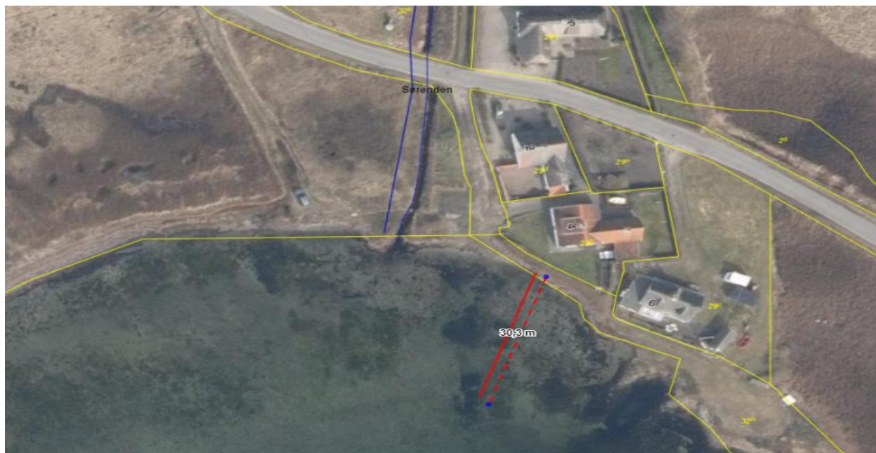
Fig. 1. Luftfoto over den nye bros placering