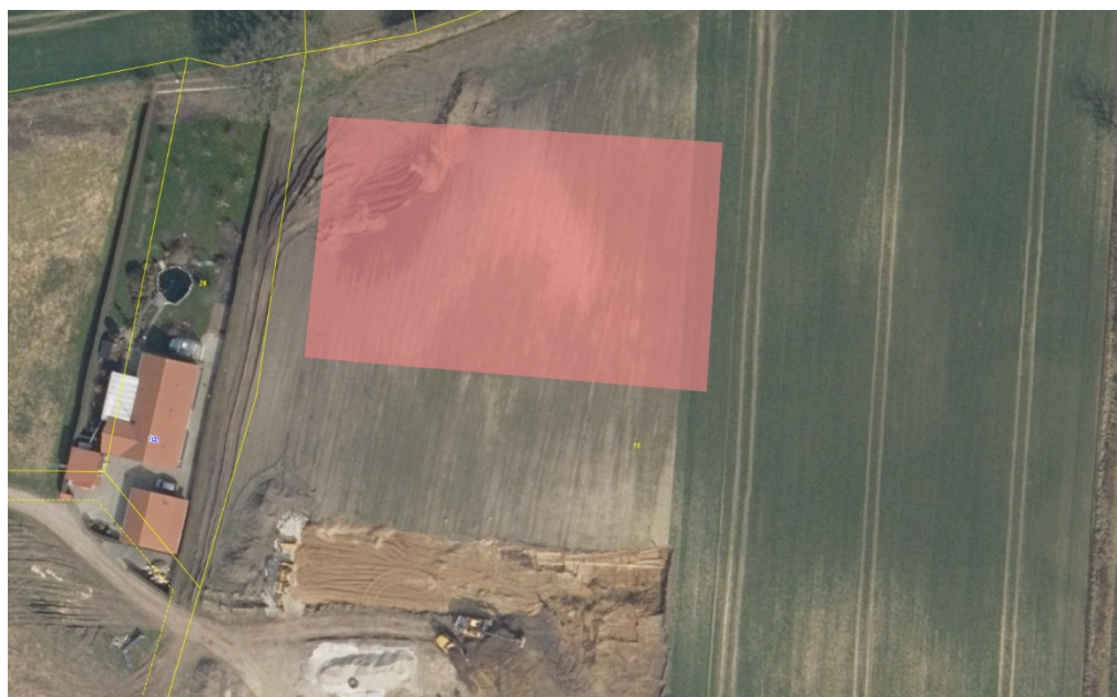
Omtrentlig placering af ridebanen.

Assens Kommune giver landzonetilladelse til etablering af ridebane som ansøgt på ejendommen matr. nr. 16, Bukkerup By, Søllested, beliggende Bogensevej 98, 5620 Glamsbjerg.