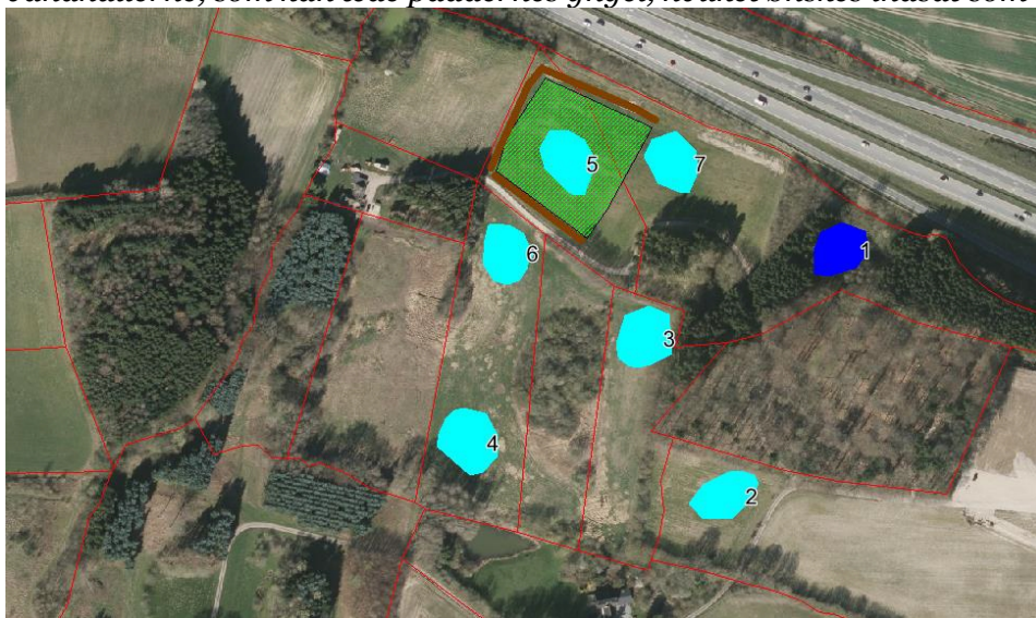
Figur 1: Detailkort for placering af erstatningsnatur og vandhuller.

Det forudsættes, at der ikke udsættes eller fodres ænder, gæs, fisk, krebs eller andre dyr i vandhullerne, som kan æde padderens yngel, hvilket ønskes indsat som et vilkår.