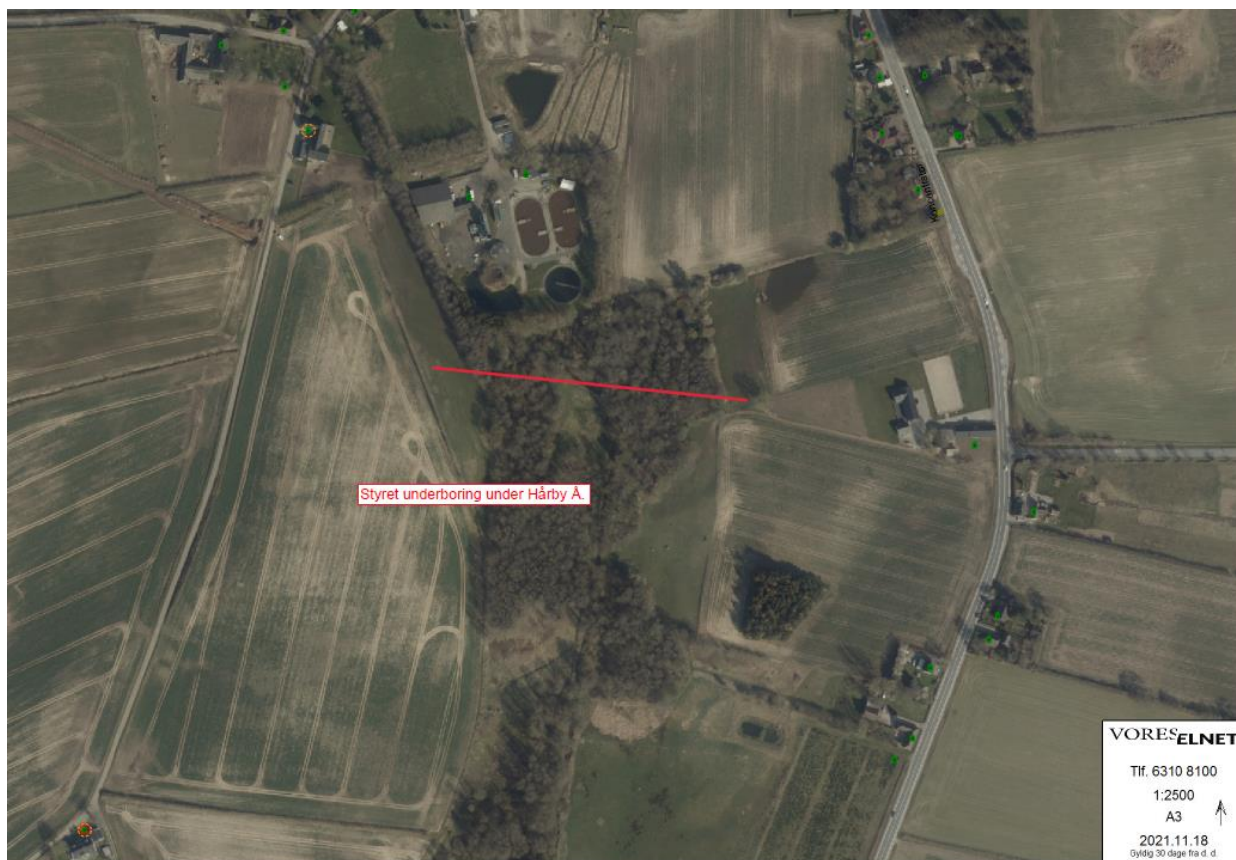
Kort 1. Luftfoto m. krydsningssted på Haarby å syd for Gummerup rensningsanlæg, Krogen 3A.