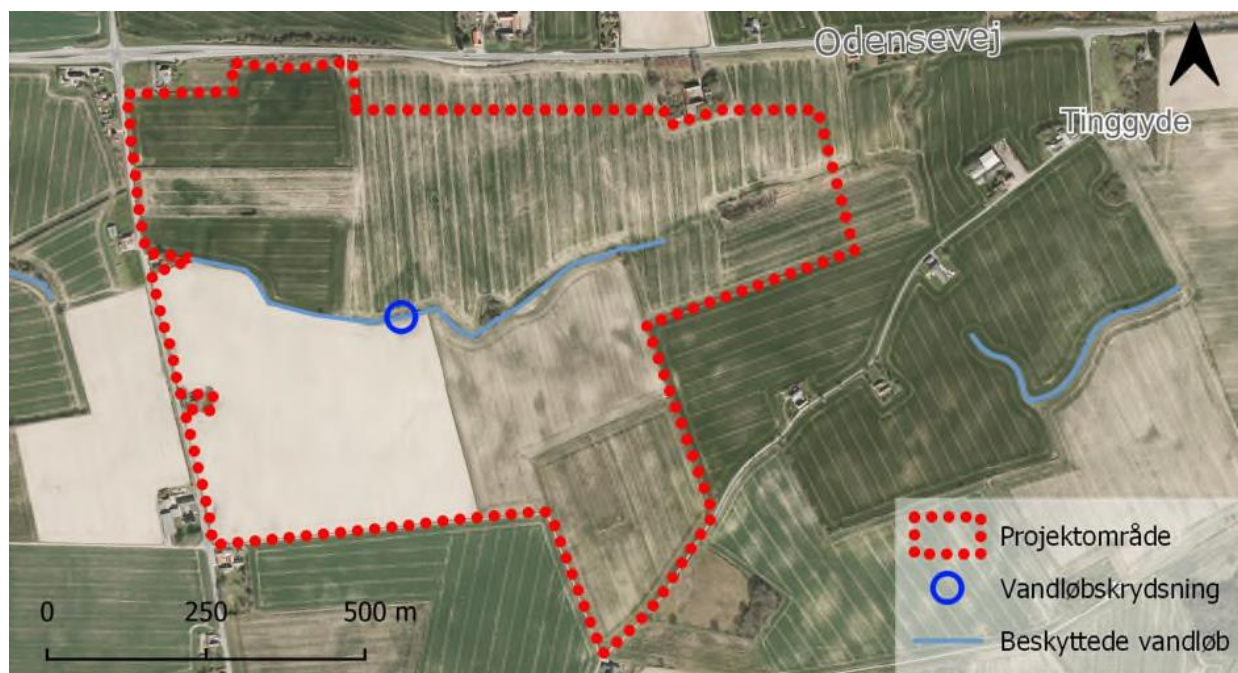
Kort 1. Luftfoto m. krydsningssted på Kærums å ved Ravnekærvej.