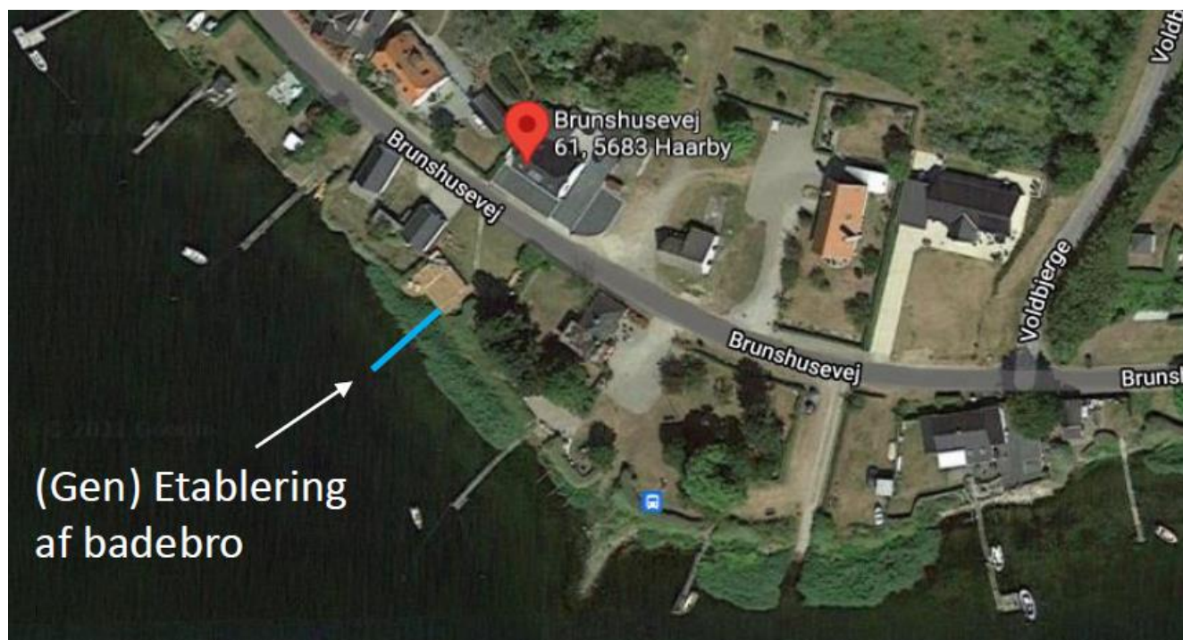
Fig. 1. Luftfoto over den nye bros placering