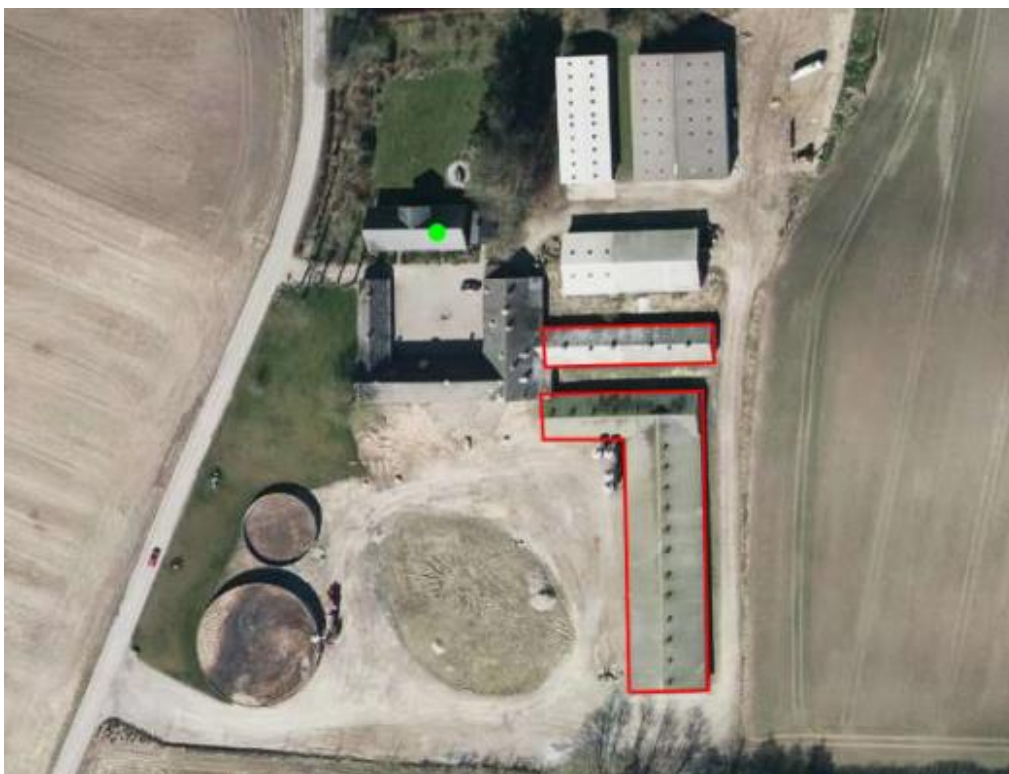
Figur 1: Anlægsoversigt

I nudrift er der 2.090 stipladser med delvis spaltegulv hvor der produceres 9.035 stk. slagtesvin (30-100 kg).