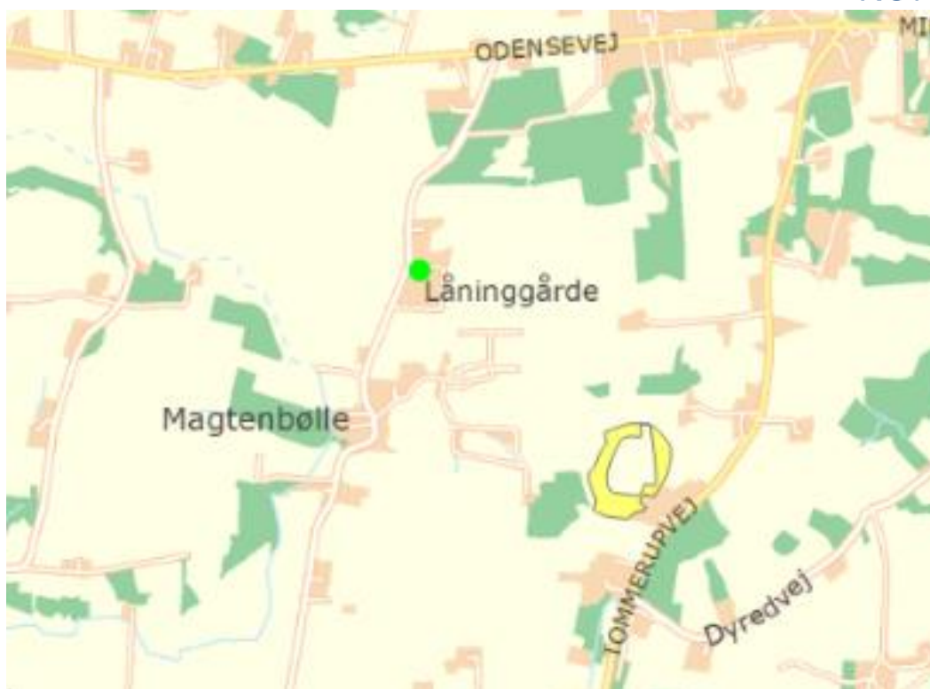
Figur 2: Låninggårdes staldanlægs placering i forhold til nærmeste kategori 2-naturområde.