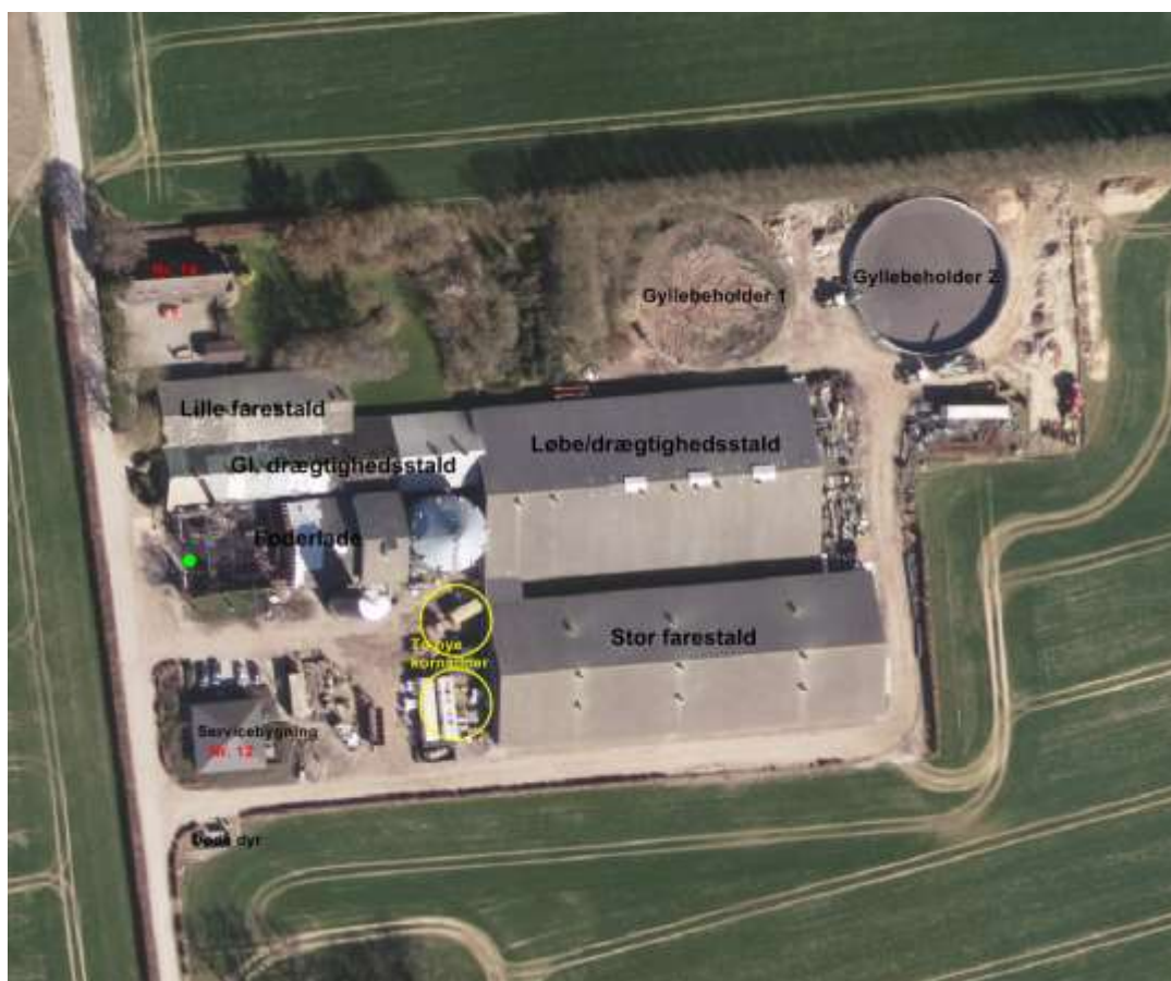
Figur 1: Anlægsoversigt Hedekrogen 14 (og 12), 5620 Glamsbjerg,

Der er søgt om en ændring fra et godkendt dyrehold på 1.150 årssøer med smågrise til fravæning, 875 stk. polte (30 – 100 kg) og 36.400 stk. smågrise til 30 kg svarende til 441 dyrenheder (DE) til et dyrehold på 1.650 diegivende årssøer med smågrise til fravæning og 1.450 drægtige årssøer svarende til 341,3 DE – 200 drægtige årssøer opstaldes på en anden ejendom. Jf. indledning er den tekniske nudrift på 1.050 årssøer med smågrise fravæning, 750 stk. smågrise til 30 kg og 650 stk. slagtesvin (30 – 100 kg) svarende til 255,7 DE.