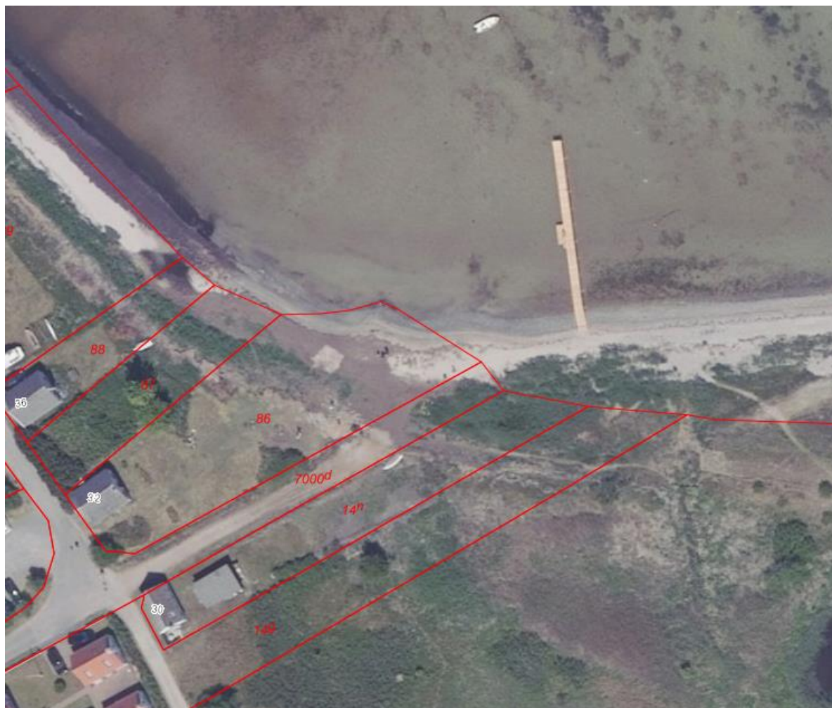
Fig. 1 , Matrikelkort. Broen er placeret som vist ovenfor og ønskes forlænget til 50 m som vist på ansøgers indsendte skitse (Fig. 2).