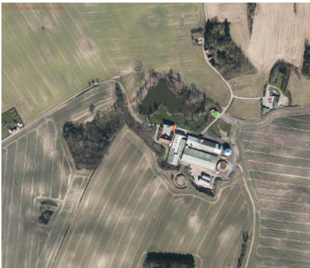
Figur 2: Nærmeste naboer til ejendommen Truelsemosegård, Skovsbjergvej 22, 5631 Ebberup.

Den ejendom der ligger tættest på Truelsemosegård er Skovsbjergvej 20 lige nordøst for staldanlægget, som ejes af ansøger Steen Gjelstrup Stenskrog. Den korteste afstand fra staldanlægget til Skovsbjergvej 22 er på ca. 70 meter.