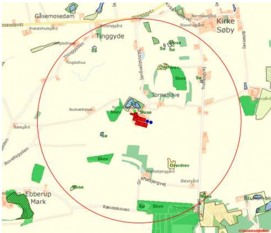
Figur 4: Oversigt over beskyttede § 3 naturområder (skraveret) og skove (grønne og grønskraveret) ifølge Kommuneplanen inden for 1.000 meter af staldanlægget på Truelsemosegård.

Inden for 1.000 meter zonen omkring staldanlægget ligger der en mose og flere søer beskyttet efter § 3 i naturbeskyttelsesloven, samt en del skove (se figur 4).