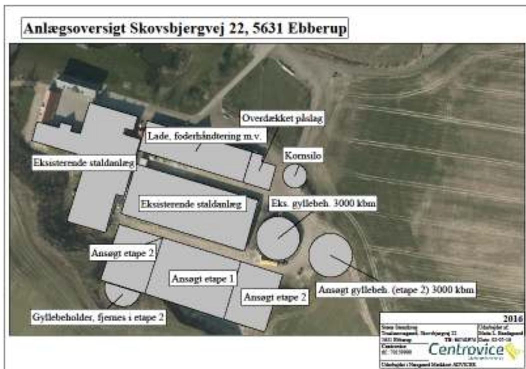
Figur 1: Anlægsoversigt Truelsemosegård, Skovsbjergvej 22, 5631 Ebberup.

Der er søgt om udvidelse fra et godkendt dyrehold bestående af en årsproduktion på 1.350 årssøer (med grise til 8 kg) og 751 stk. polte (30 – 102 kg) svarende til 330,1 dyreenheder (DE) til en årsproduktion 1.950 årssøer (med grise til 7,1 kg og 35 stk. fravænnede grise pr. årssø) og 5.000 stk. slagtesvin (31 – 110 kg) svarende til 577,7 DE. I henhold til § 26, stk. 2 i husdyrgodkendelsesloven (se indledning) er den beregningstekniske nudrift en produktion på 715 årssøer og 4.700 slagtesvin svarende til 274 DE.