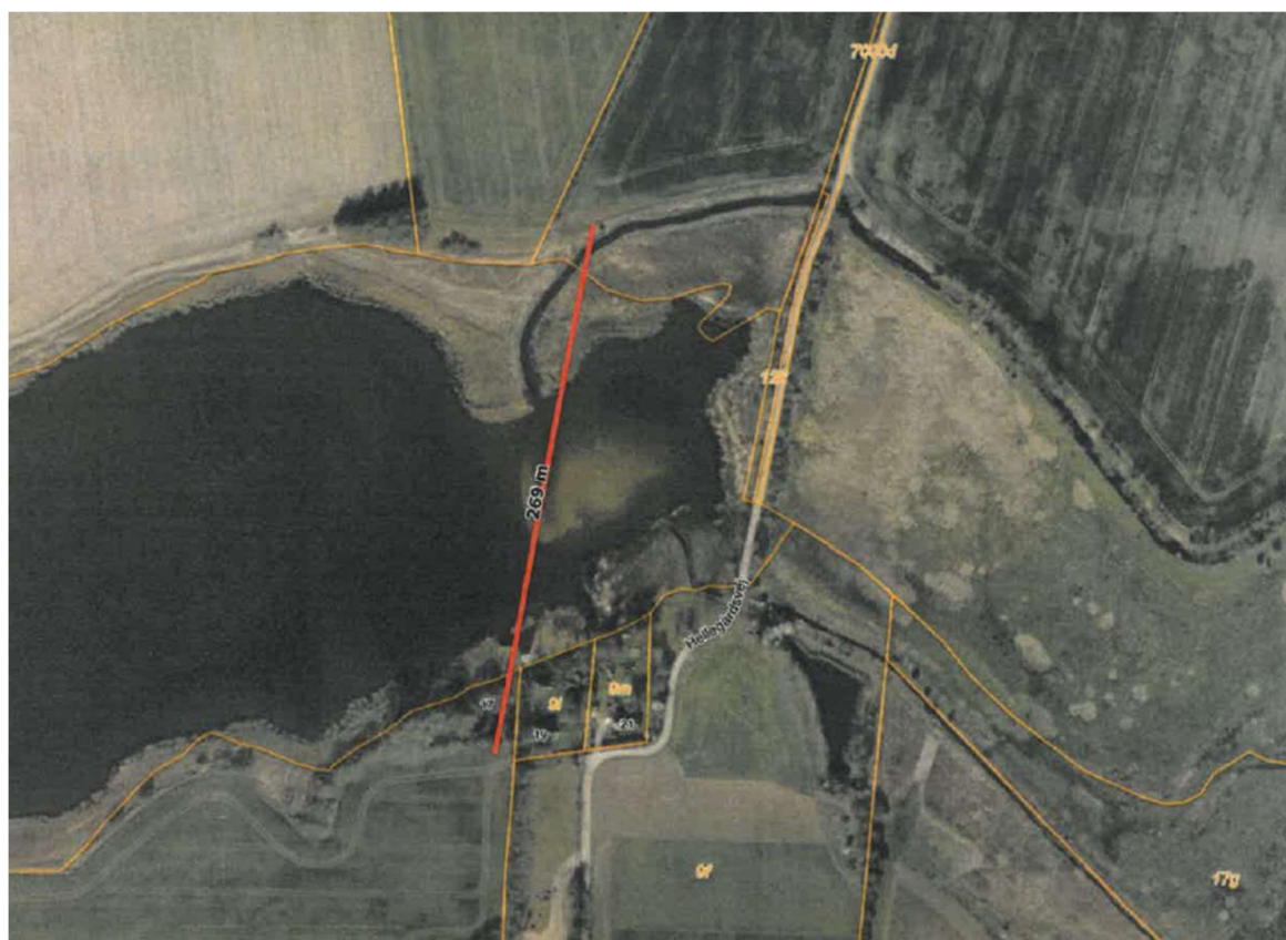
Kort 2. Ledningsplacering ved krydsning af Aborg Minde og Puge Mølle å ved station 1050.