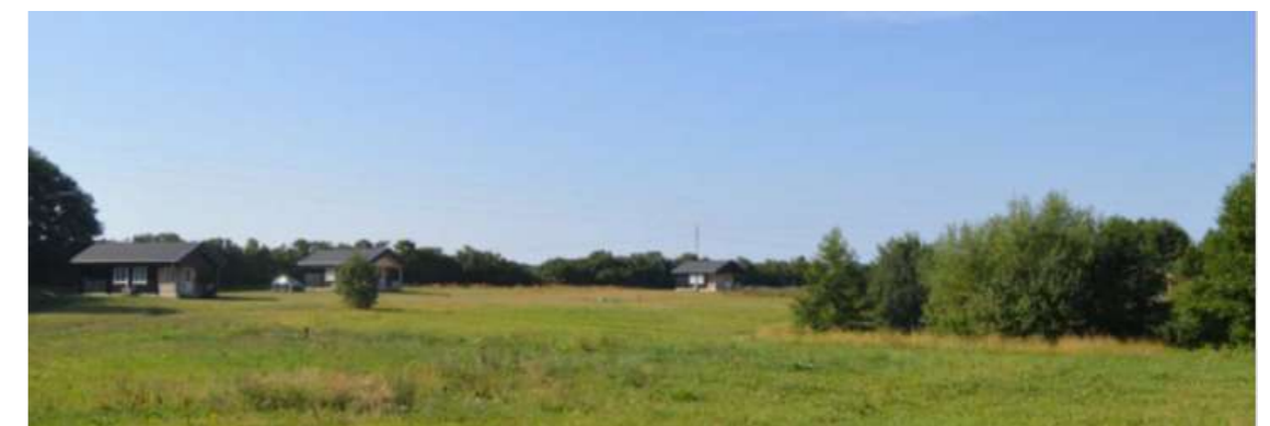
Inspirations foto fra lokalplan for Nørre Broby visende den ønskede placering af hytter i landskabet.

Se den grønne kolonne for yderligere information.