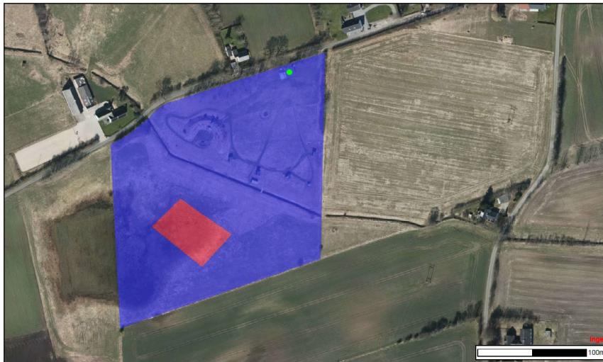
Figur 2: Oversigtsbillede med angivelse af jordforurening. Blå områder er kortlagt på vidensniveau 1 (V1), og røde områder er kortlagt på vidensniveau 2 (V2).

Assens Kommune fremsendte analyserapporten fra COWI A/S til Region Syddanmark, der efterfølgende foretog en kortlægning af matr. nr. 1g Tommerup By, Tommerup. Region Syddanmark meddelte d. 26. juni 2013, at matriklen var blevet forureningskortlagt vidensniveau 1 og 2 efter Jordforureningsloven 13 . Områderne er vist på figur 2.