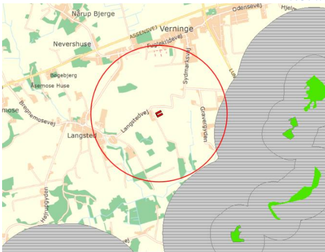
Figur 3: Holmegårds staldanlægs placering i forhold til § 7 naturområder (her vist med de tidligere bufferzoner) – den røde cirkel angiver 1.000 meter grænsen fra staldanlægget.