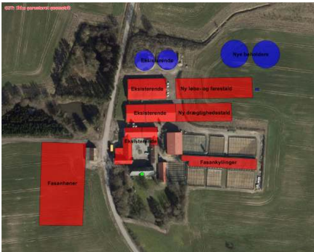
Figur 1: Anlægsoversigt Vennersminde, Toftevej 56, 5690 Tommerup.

Der er søgt om udvidelse fra et tilladt dyrehold bestående af en årsproduktion på 1.145 årssøer, 34.350 smågrise (7,2 – 30 kg) og 45.000 fasankyllinger svarende til 427,8 dyreenheder (DE) til en årsproduktion på 1.620 årssøer, 16.000 stk. smågrise (7,2 – 32 kg) og 43.500 fasankyllinger svarende til 453,8 DE.