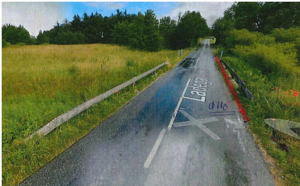
Kort. 1-3. Krydsning af Ladegårds Å med \varnothing 110 mm kabelrør til 10 kV kabel.