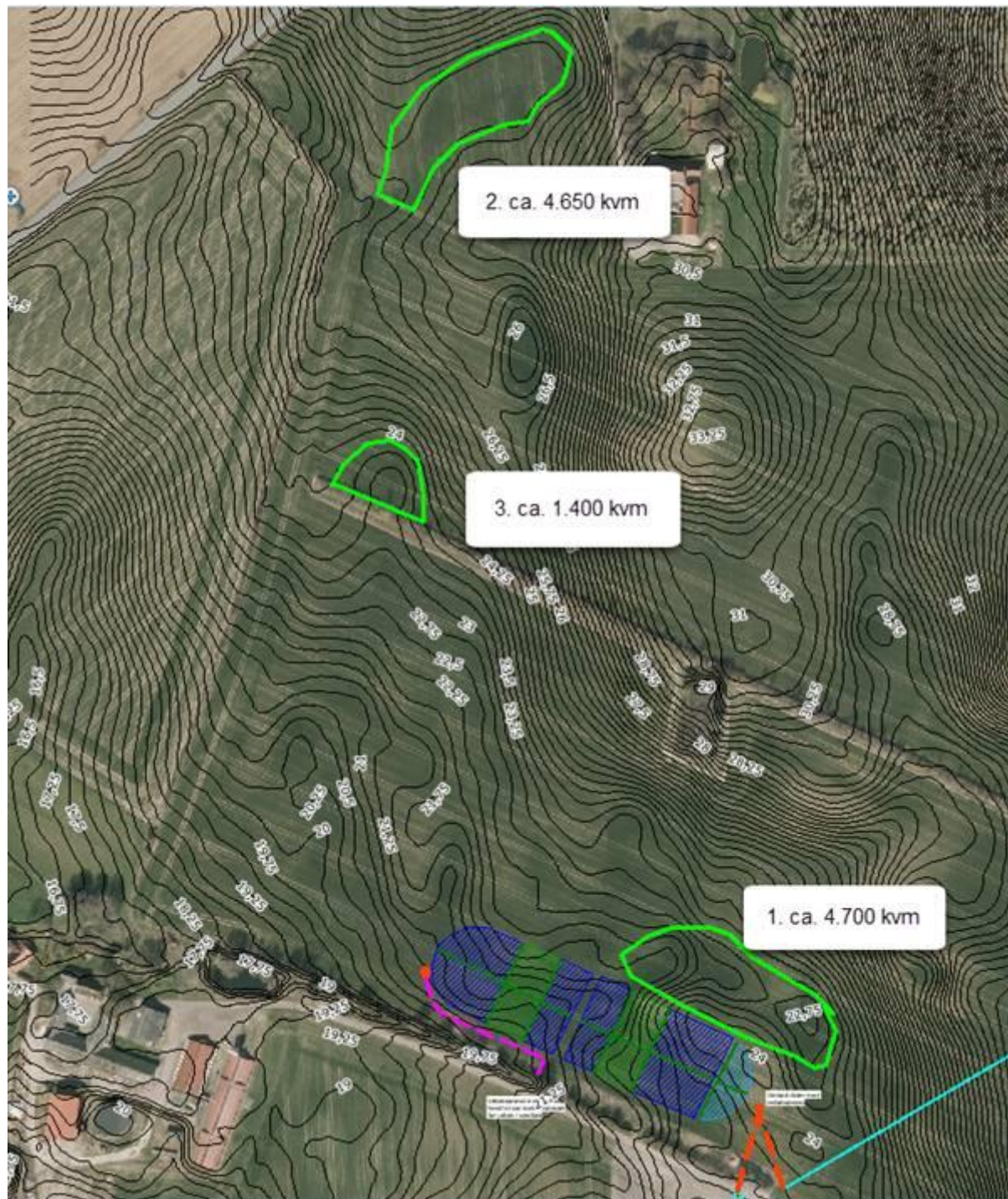
Kort 2. Ønske om placering af overskudsjord