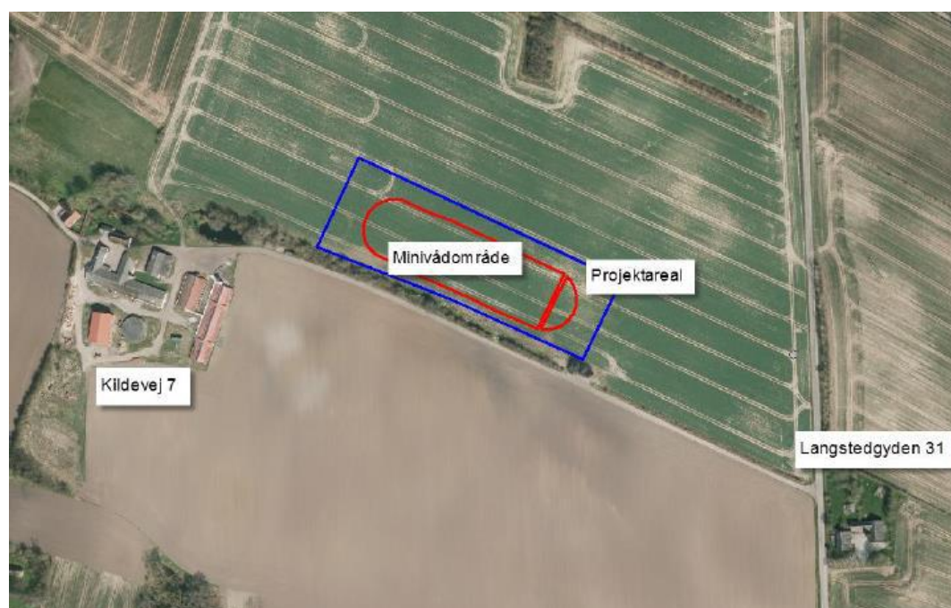
Fig. 1. Oversigtskort over minivådområde. Det blå område, omkranser projektområdet og det røde område omkranser minivådområdet.