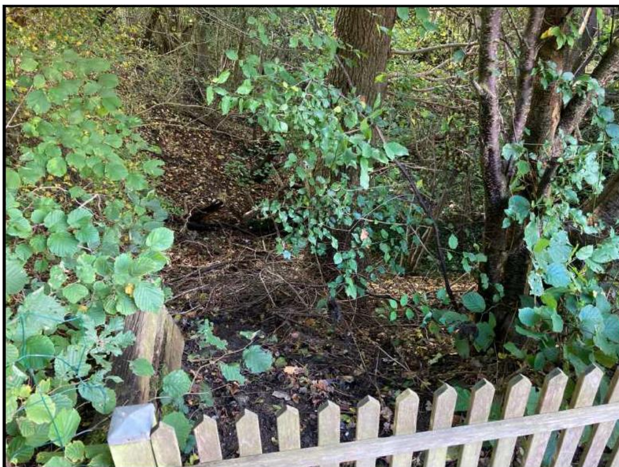
Foto 3. Duedalen 30-32, Mergelhul/lavning ved skel d. 12.10.2020.