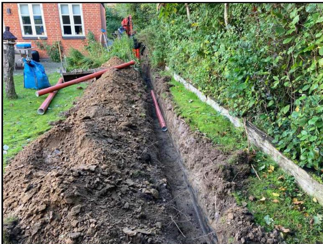
Foto 1. Duedalen 30-32, placering af rørledning langs gavlen d. 12.10.2020.