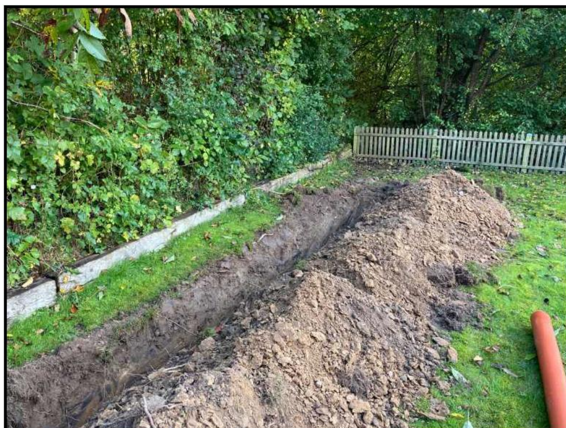
Foto 2. Duedalen 30-32, placering af rørledning frem til skel ved lavning d. 12.10.2020.