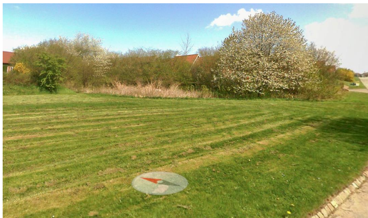
Foto 4. Duedalen 30-32, Mergelhul/lavning ved vejen.