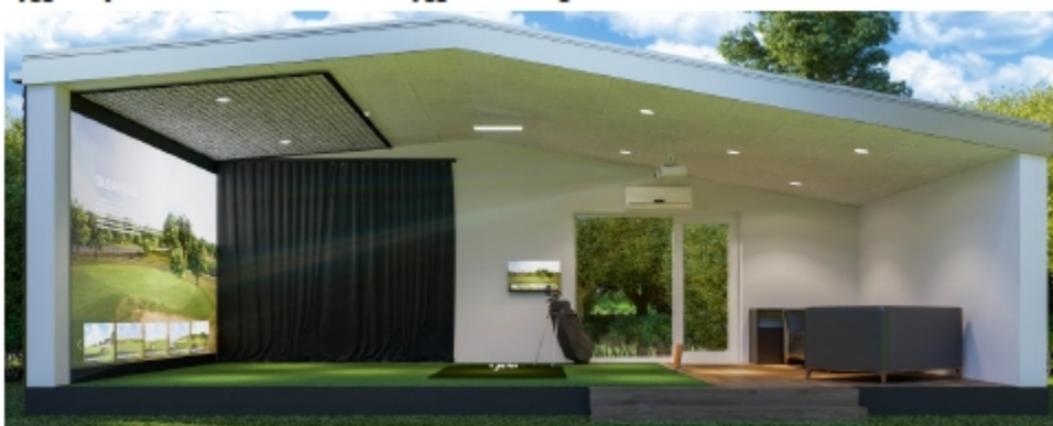
Figur 1 - Visualisering af en TEEBOX pavillon (væg fjernet på visualisering).