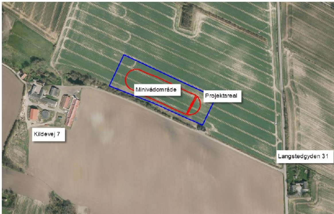
Fig. 1. Oversigtskort over minivådområde med naboejendomme.