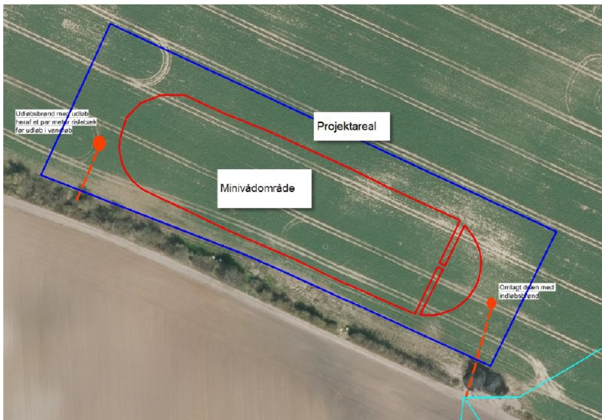
Fig. 4. Minivådområde med eksisterende dræn, omlægning af dræn samt ind-og udløb