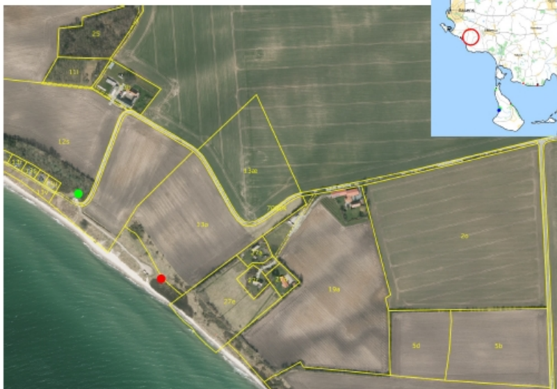
Oversigtskort over shilternes placering på matrikel 13ø Saltofte By, Kærumsø