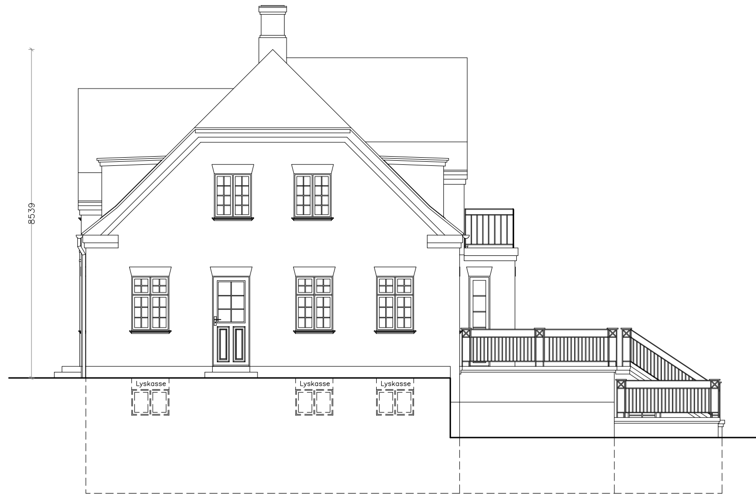
Facade mod nord