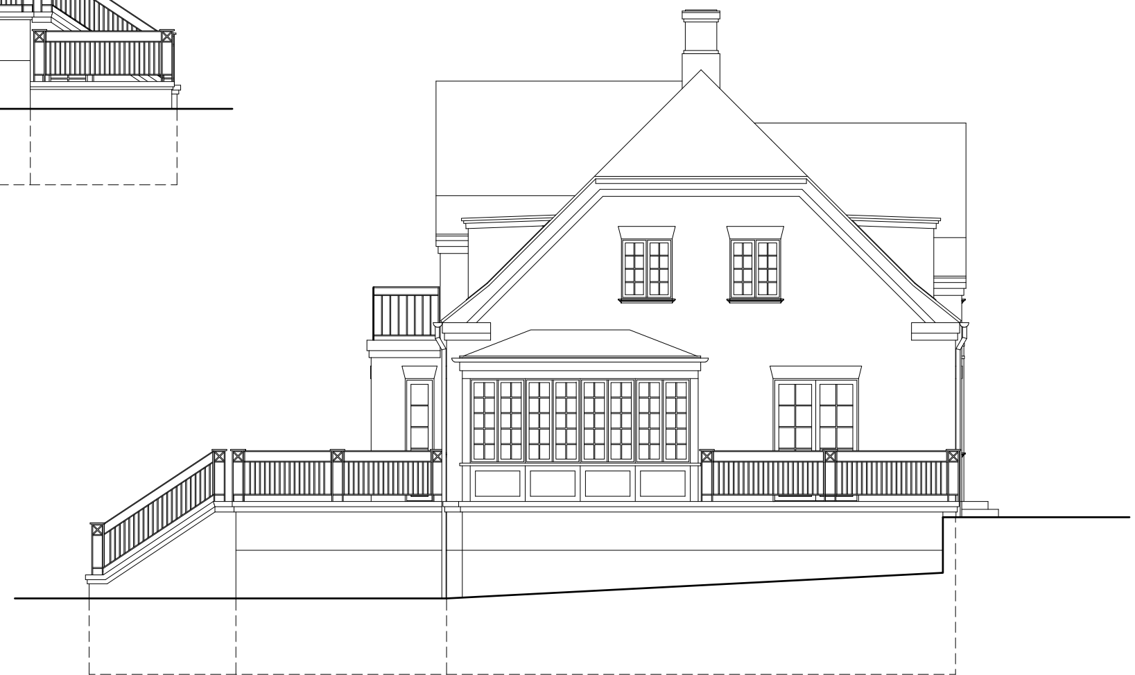
Facade mod syd