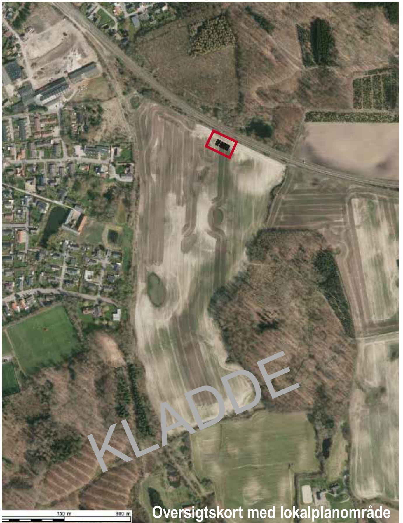
Oversigtskort med lokalplanområde