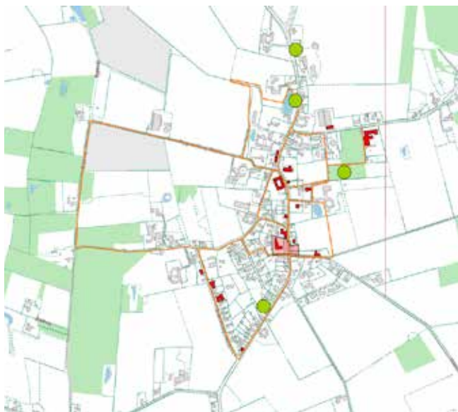
Byens spor med stier, huse med en særlig historie, Landevejens forløb og grønne rum/pladser.

rundt i byen via fx Apps og QR-koder mv. Herunder en afmærkning af ruten.