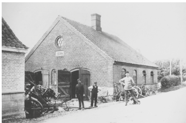
Den Gamle Smedie, der står intakt, og kan indgå i den kulturhistoriske fortælling.

Udfordringen er dog, at man ikke associerer Jordløse med disse kvaliteter. Derfor er der brug for at skabe en større synlighed af eksisterende forbindelser, samt at etablere nye forbindelser fra byen og ud til de omkringliggende natur- og landskabsværdier. Samtidig er de eksisterende natur- og landskabsforbindelser ikke koblet direkte med Jordløse, men ligger som fragmenter, der med fordel kan sammenbindes med byen. Herved vil Jordløse blive en del af de oplevelser, der ligger i landskabet omkring, og Jordløse vil blive noget særligt, hvilket både kan bidrage til at fastholde nuværende borgere og tiltrække potentielle tilflyttere.