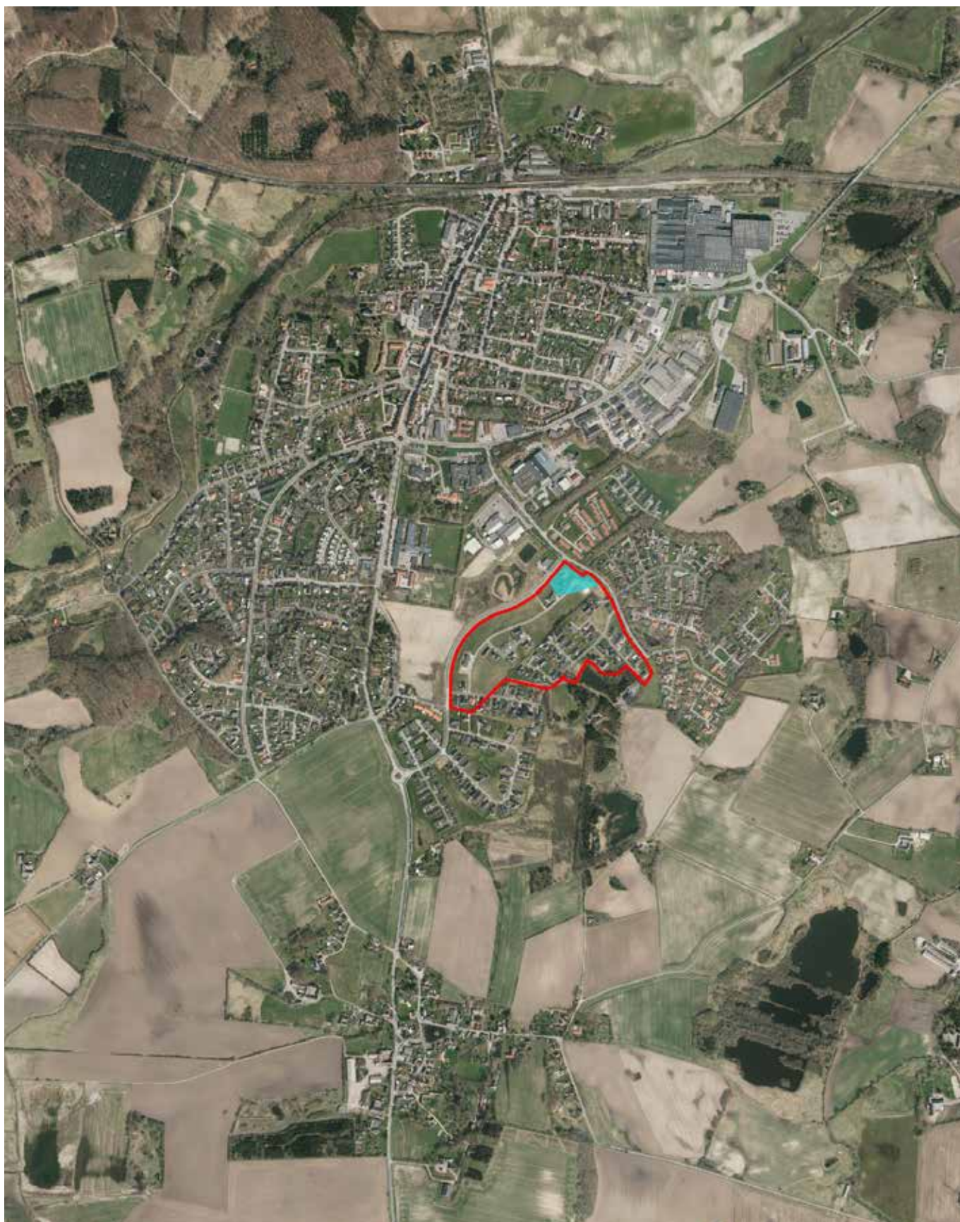
Kort 1: Kommunplanramme 2.1.T.3, der aflyses, er vist med blå markering. Rammeområdet lægges ind under Kommunepanramme 2.1.B.7 Boligområde - Troldebakken og Eventyrbakken, Aarup, der er vist med rød streg..