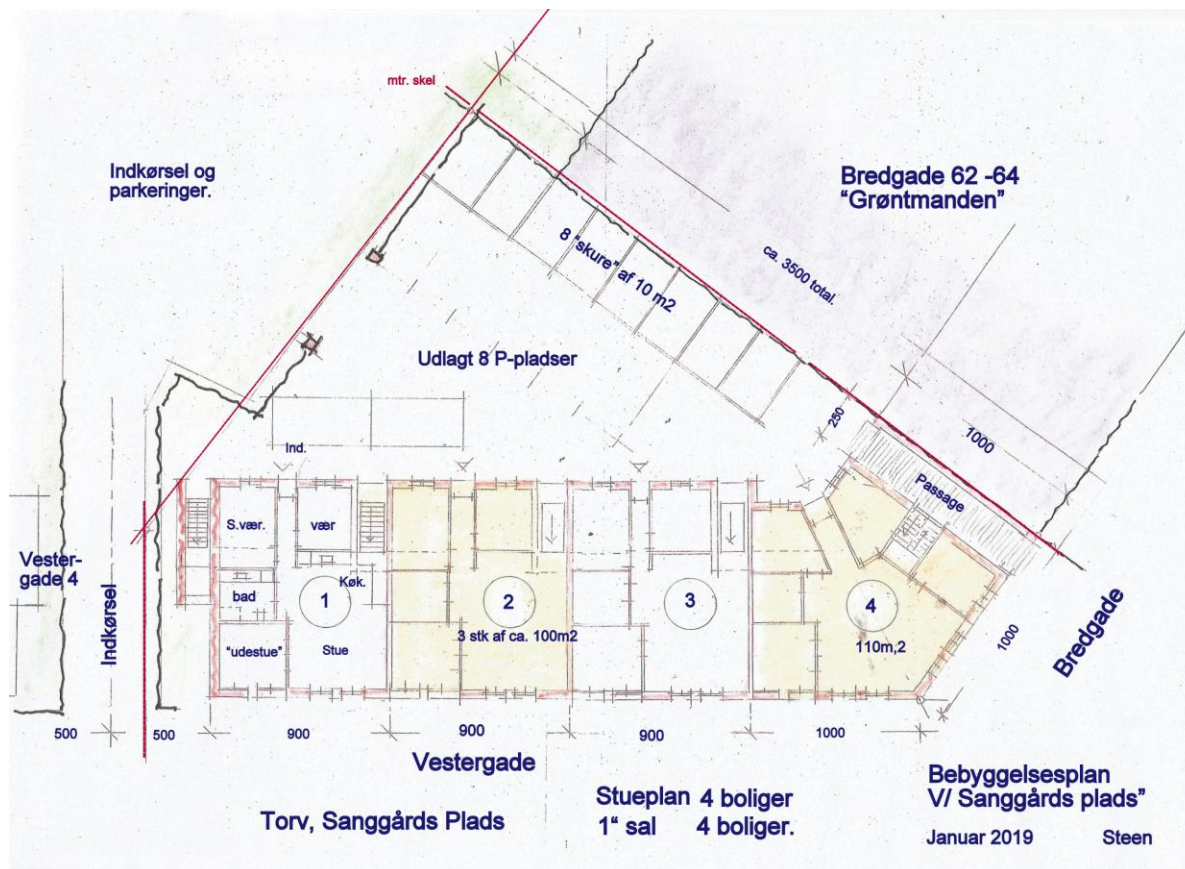
Plantegning, opførelse af 8 boliger, imod Bredgade og Vestergade.