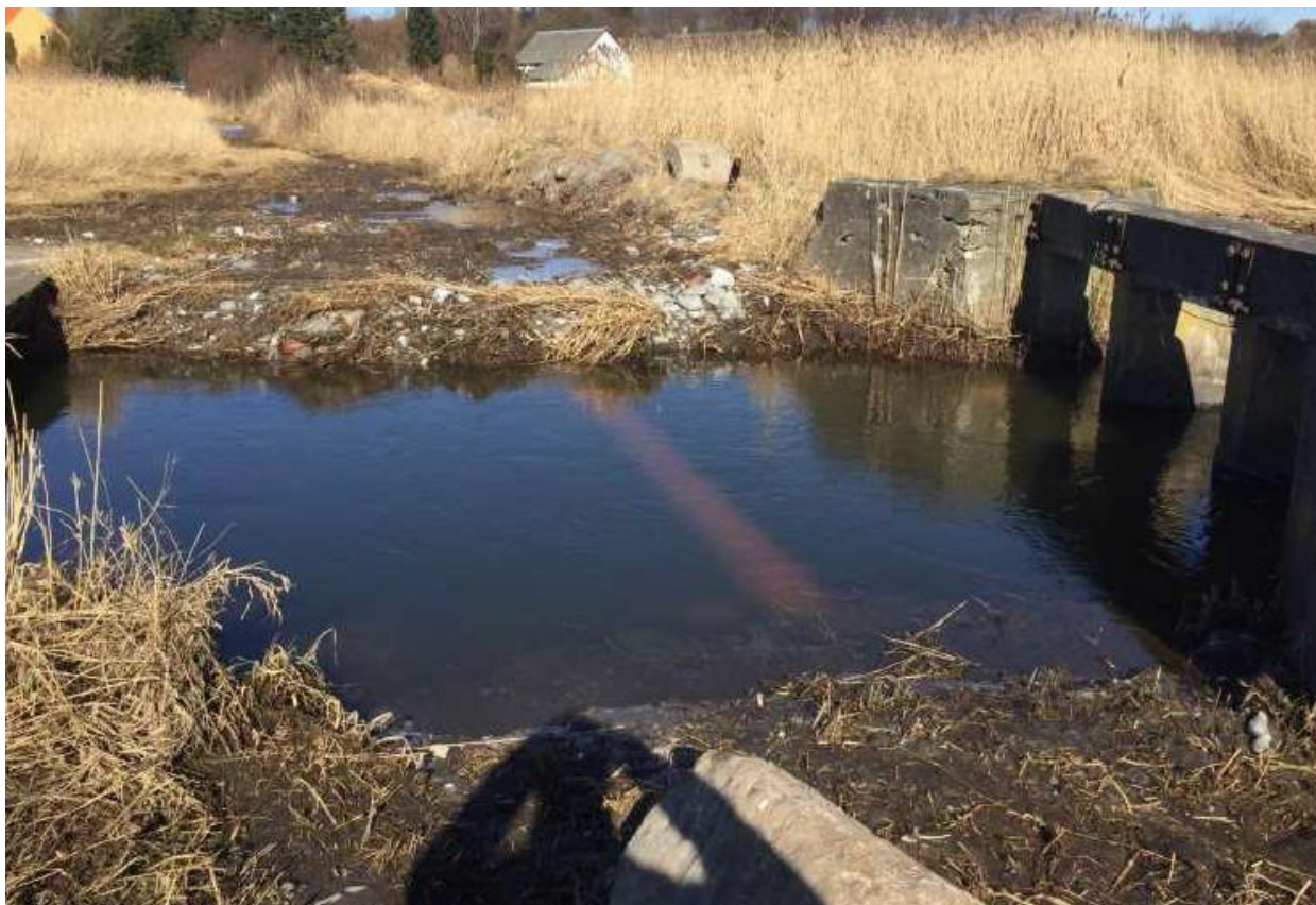
Foto 1. Eksisterende hovedledning over vandløbsbunden