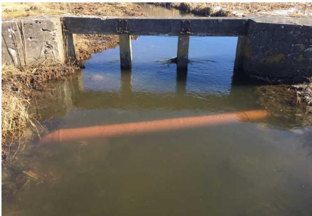
Foto 2. Eksisterende hovedledning over vandløbsbunden