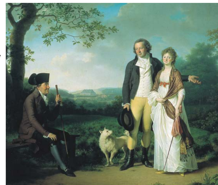
Statens Museum for Kunst