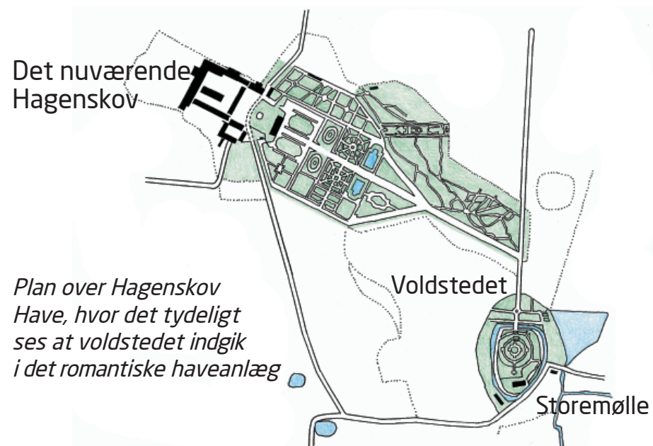
Plan over Hagenskov Have, hvor det tydeligt ses at voldstedet indgik i det romantiske haveanlæg